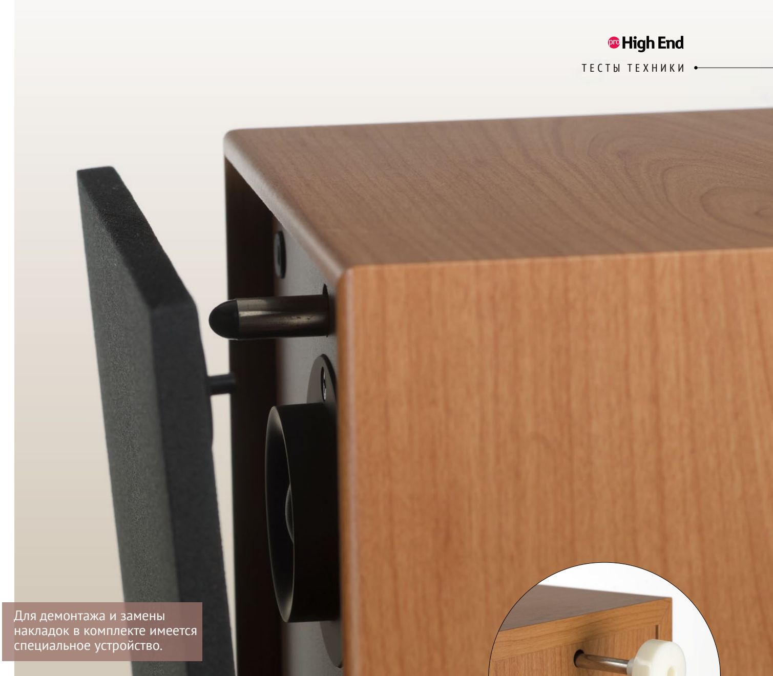
Для демонтажа и замены накладок в комплекте имеется специальное устройство.